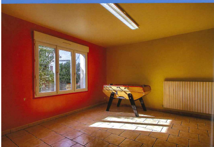
La pièce annexe